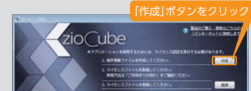
▲ ライセンス認証画面